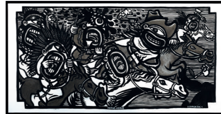
HERGÉ - HERVÉ (hommage à HERGÉ)