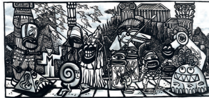
ANTIC CLASSIC (hommage à Jacques MARTIN)