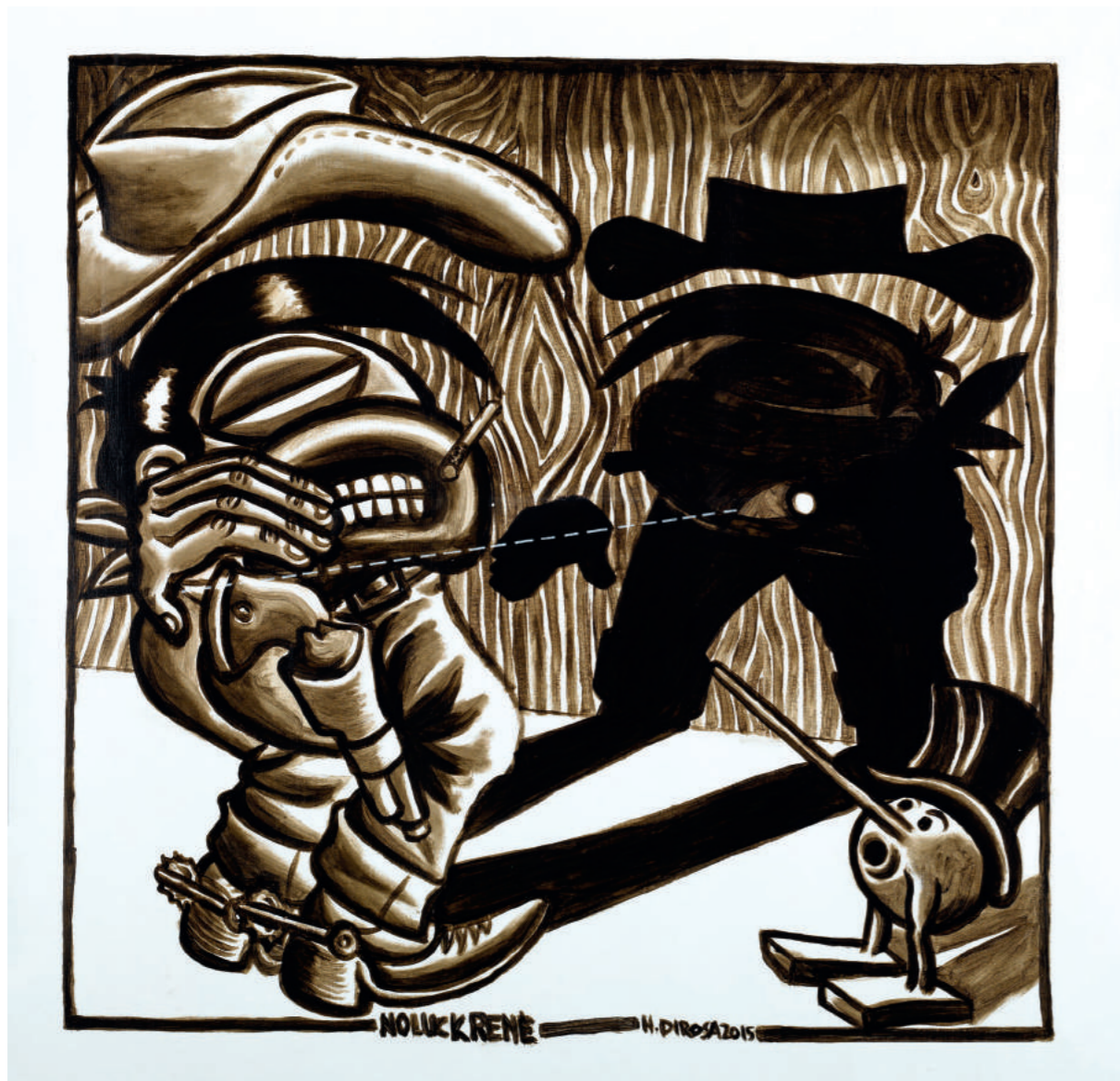
NO LUCK RENÉ (hommage à MORRIS)